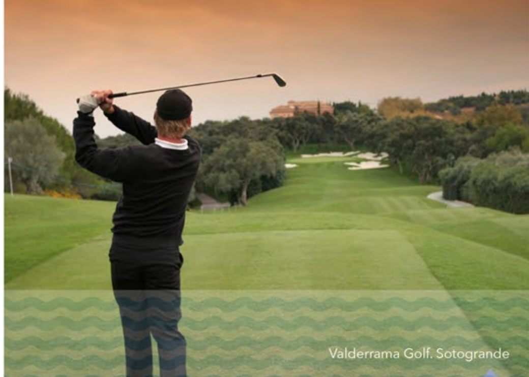
Valderrama Golf. Sotogrande