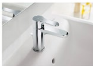
Grifería monomando L20