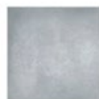
Atenea Aloe gris 60,75 x 60,75 cm