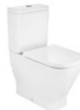
Inodoro - The gap square

Nota: Todos los acabados o elementos descritos en la presenta pueden sufrir modificaciones o ser sustituidos por elementos de igual o superior calidad por decisiones técnicas, cambios de modelos de fabricación o cambios de normativa a aplicar.