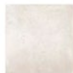
ATENEA Aloe beige 60,75 x 60,75 cm

Nota: Todos los acabados o elementos descritos en la presenta pueden sufrir modificaciones o ser sustituidos por elementos de igual o superior calidad por decisiones técnicas, cambios de modelos de fabricación o cambios de normativa a aplicar.