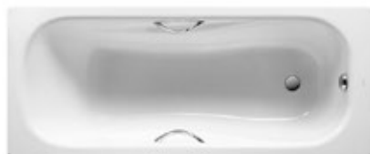
Bañera ROCA Princess

Shower trays with glass and stainless steel screen.