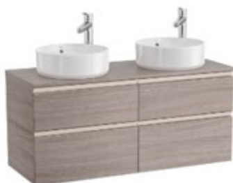
ROCA The gap round