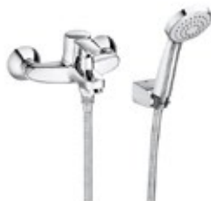
Baño ducha ROCA