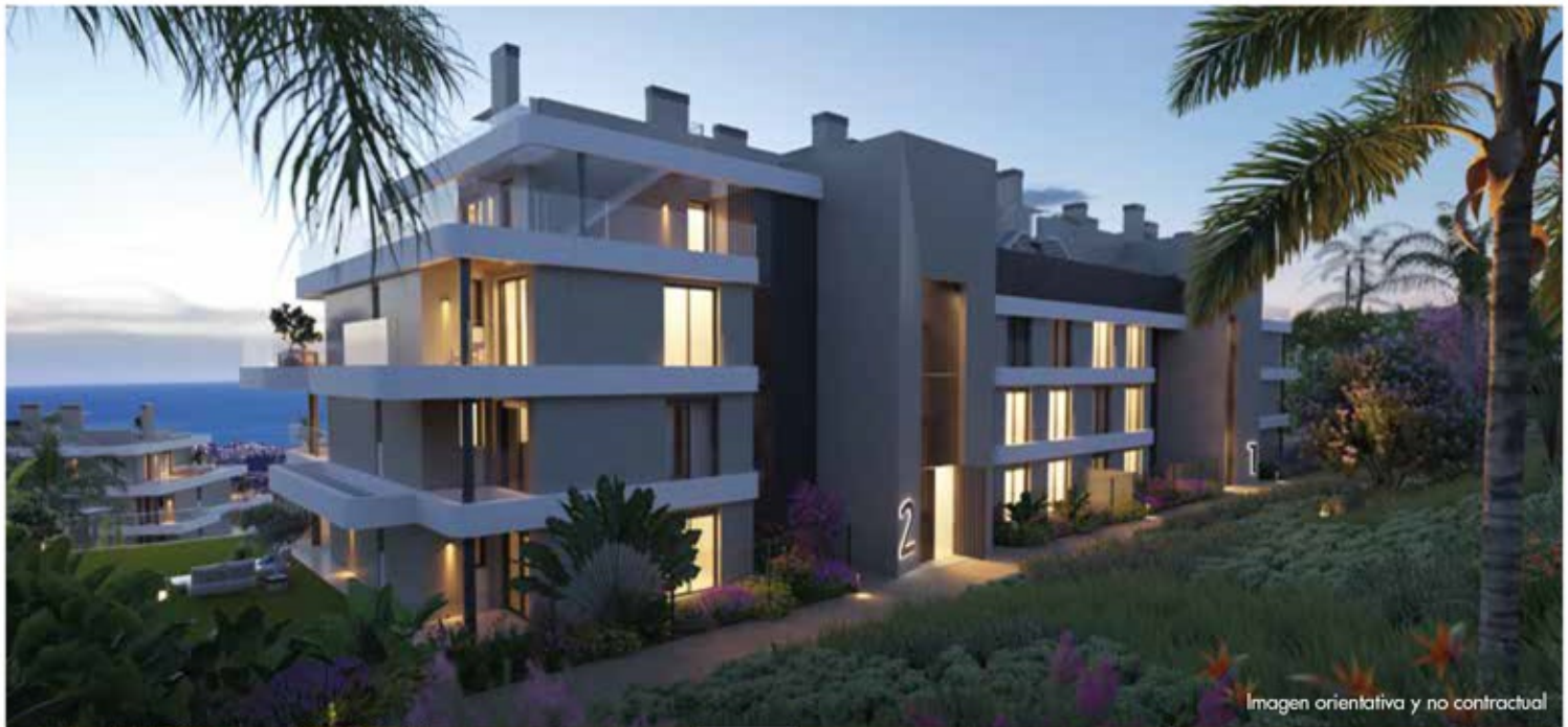
Imagen orientativa y no contractual

Calanova Collection , en Mijas, se encuentra en una ubicación estratégica que combina a la perfección un horizonte de mar y montaña.