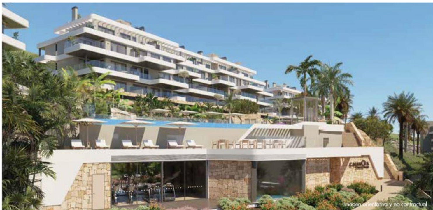
Imagen orientativa y no contractual