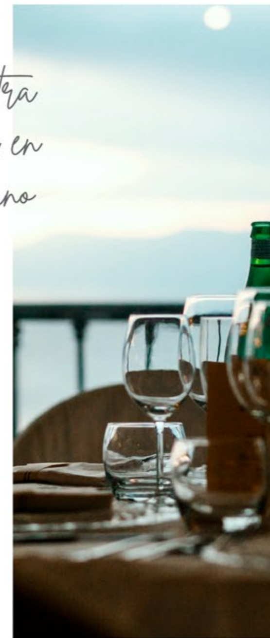
In the heart of the Costa del Sol En el corazón de la Costa del Sol