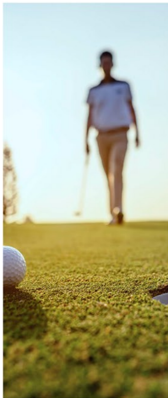
6 golf courses within a 15 km radius 6 campos de golf en un radio de 15 km