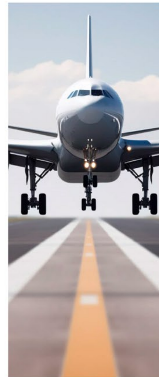
22 min from Malaga International Airport A 22 min del Aeropuerto Internacional de Málaga