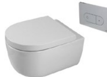
Acro Compact suspended toilet Inodoro suspendido Acro Compact