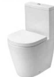
Acro Compact toilet Inodoro Acro Compact