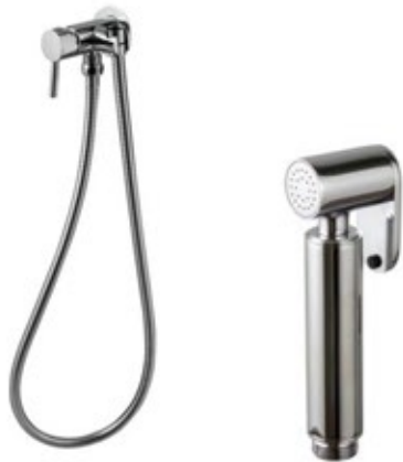
Round stainless steel single tap shower set

Monomando set ducha sanitaria Round inox