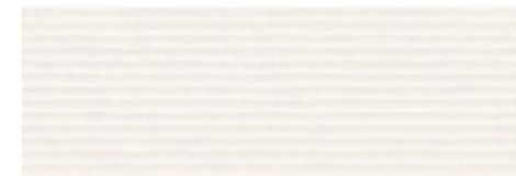
Second bathroom Decorative Old White Parcelanosa 33,3 x 100 cm