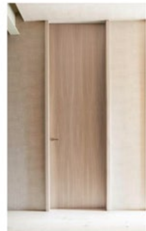
Herrajes Olivari Modelo LAMA Cromo satinado