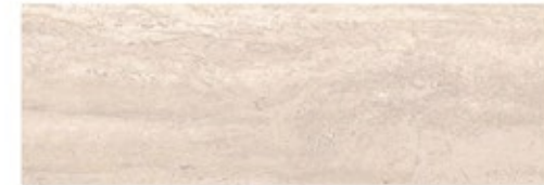
Master Decorative tiles Roma Marfil Parcelanosa 59,6x120cm