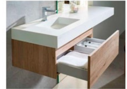
ONE Kole hanging unit