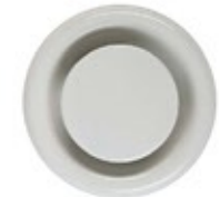
Extractor duct Boca de extracción