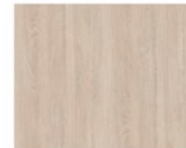
Doors Smoked Oak Puertas Roble humo