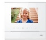
Videoportero Video intercom