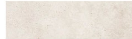
Master & Second bathroom Rectified porcelain tiles Vela Natural Parcelanosa 31,6 x 90 cm