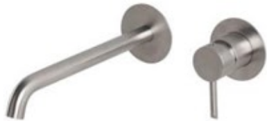
Concealed shower deck shower system.