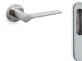
Olivari fittings LAMA model Satin-finish chrome