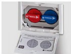
Shut-off valve. Hidden control. Llave de corte mando oculto

Two concealed shut-off valves for hot and cold water in each wet room.