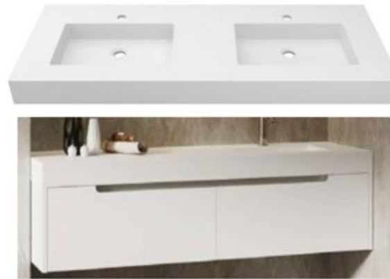
ONE hanging Kole unit Encimera Kole Mueble ONE suspendido