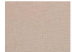
Textil Cactus textile Textil Cactus textile