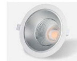
Downlight led CELER