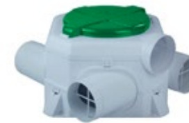
Mechanical ventilation system Sistema de ventilación mecánica