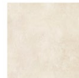
Exterior Gres porcelánico Vela Natural C3 100x100cm