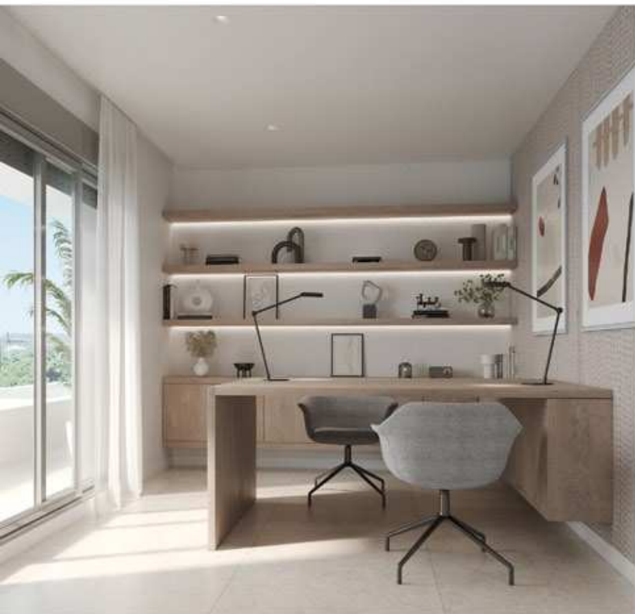
Opción Elegance en despacho

Más allá de tu casa, pero sin salir de tu urbanización, las zonas comunes y los espacios ajardinados incorporan para tu disfrute una piscina de adultos, piscina infantil, gimnasio y club social.