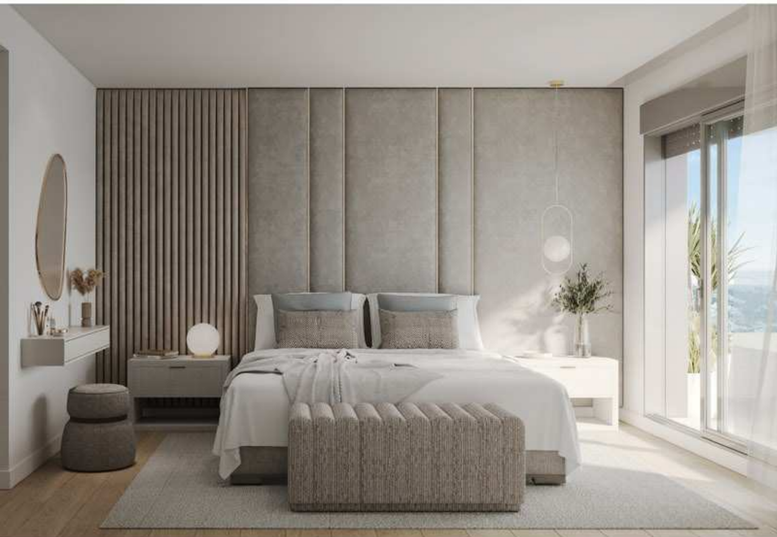
Opción Elegance en dormitorio