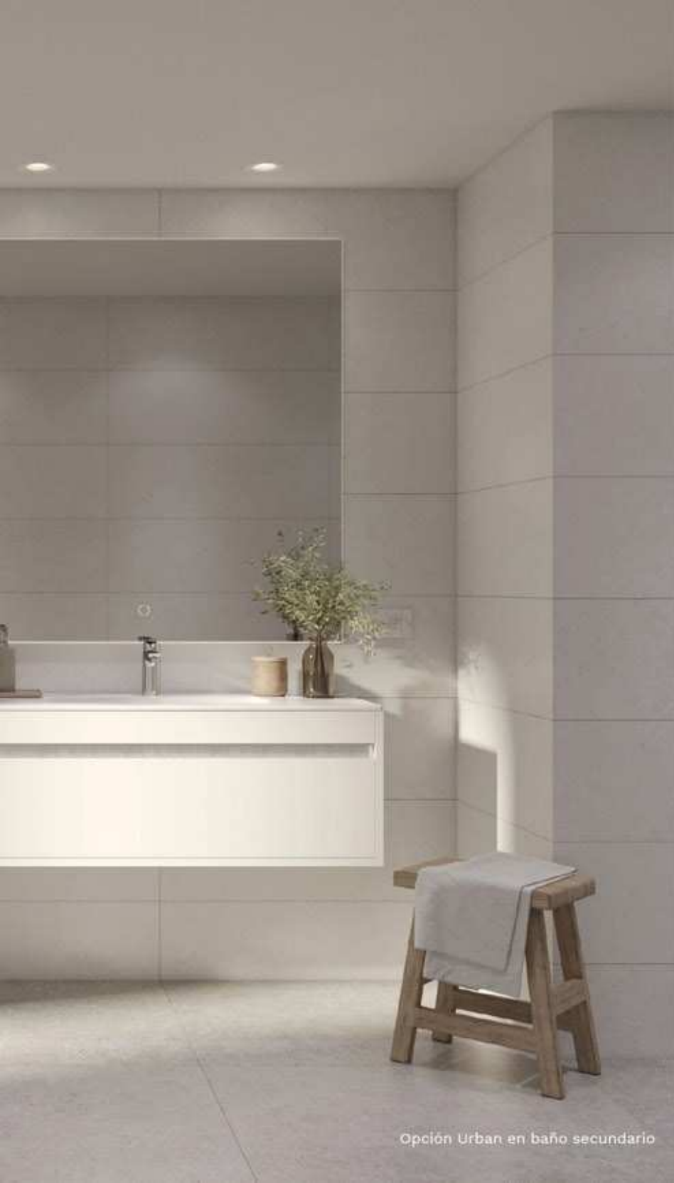
Opción Urban en baño secundario